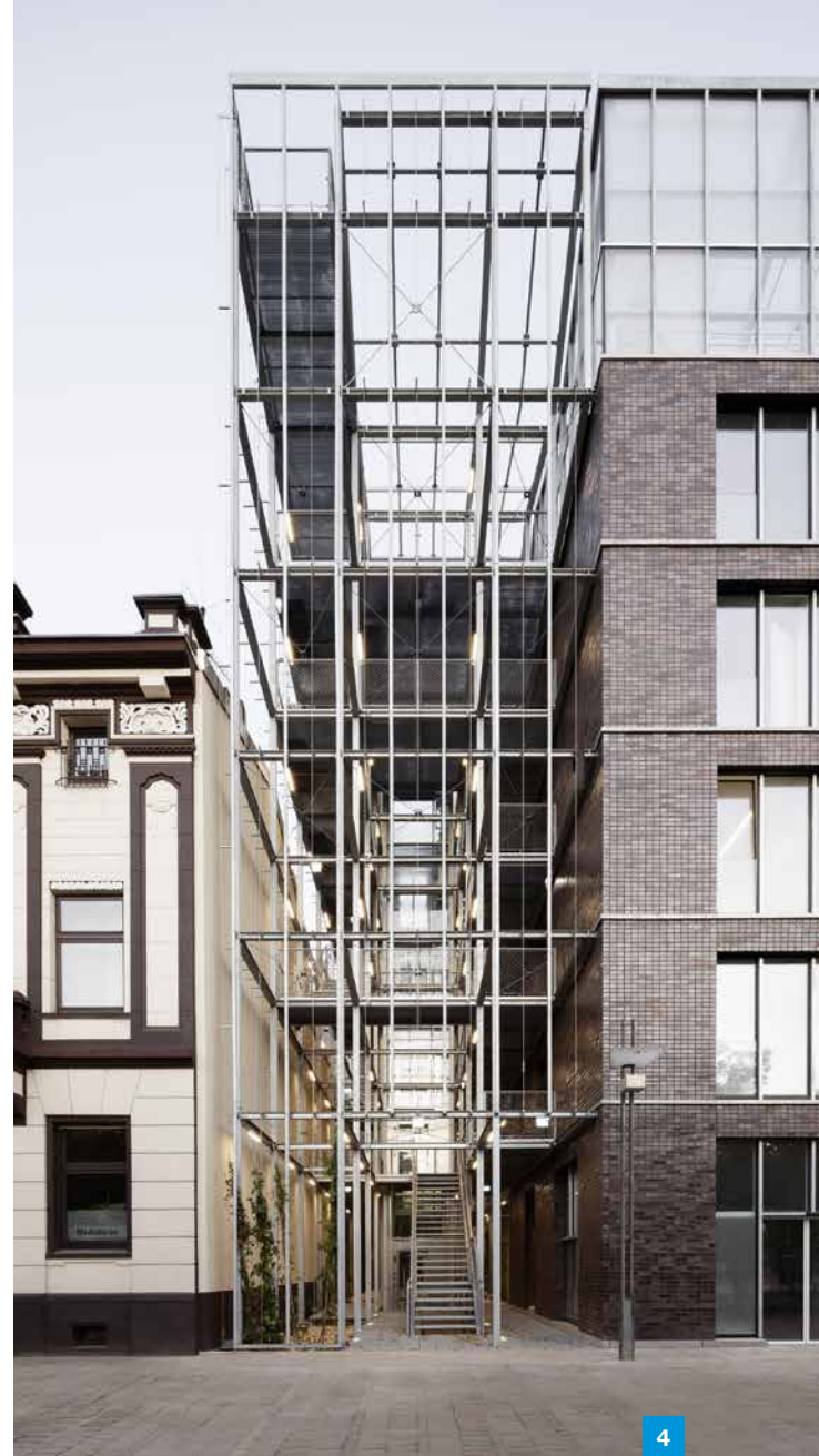
4 | Verbindet den Altmarkt Oberhausens mit dem Dachgewächshaus: Der vertikale Garten aus einem feuerverzinkten Stahl.

Der Stadt Oberhausen und den Architekten ist ein mutiger, prototypischer Bau gelungen, der in wegweisender Art aufzeigt wie eine zukunftsgerichtete Integration von nachhaltigen Funktionen wie der urbanen Landwirtschaft in den Stadtraum gelingen kann. Feuerverzinkter Stahl ist dabei ein zentraler Teil der Lösung.